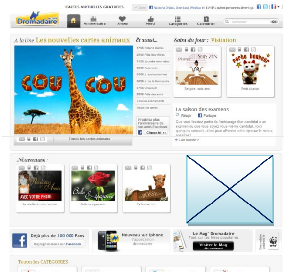
Pavé 300x250 / 300x600