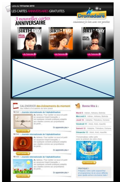
Bannière au sein d'une Newsletter éditoriale